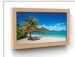
Option : Oberflächen aus Holz