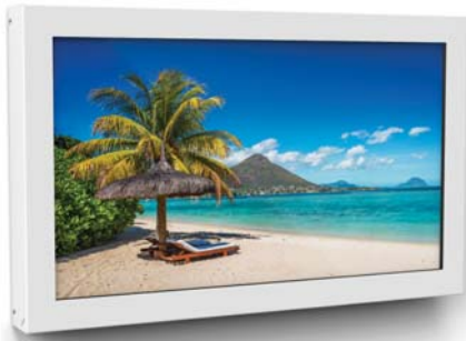
Simulation 40" Bildschirm

Dieser Träger ist je nach Modell geeignet für die Aufnahme eines 32 bis 65" Bildschirms.